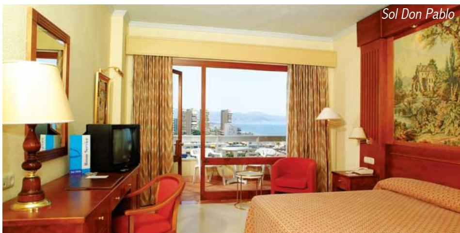
Sol Don Pablo