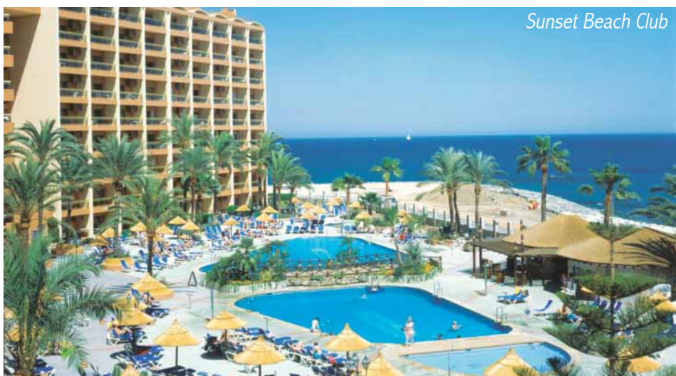
Sunset Beach Club