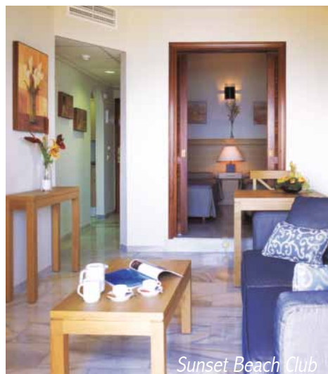
Sunset Beach Club