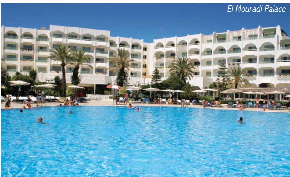
El Mouradi Palace