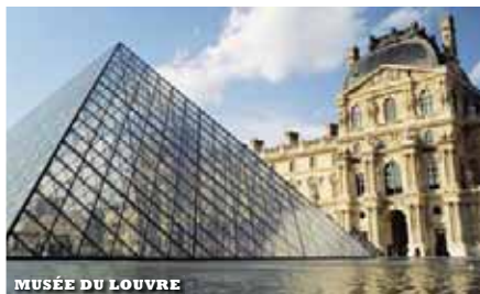
MUSÉE DU LOUVRE