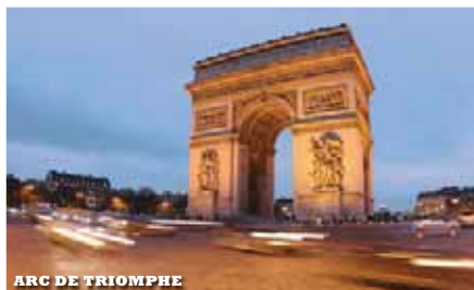
ARC DE TRIOMPHE