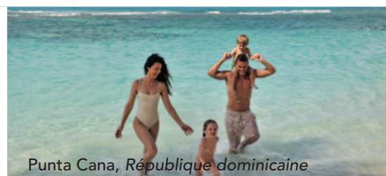
Punta Cana, République dominicaine