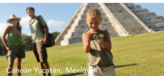
Cancún Yucatán, Mexique

Ixtapa Pacific, Mexique – Cancún Yucatán, Mexique – Punta Cana, République dominicaine – Columbus Isle, Bahamas Sandpiper Bay, Floride – Turquoise, Turks & Caïcos – Les Boucaniers, Martinique – La Caravelle, Guadeloupe